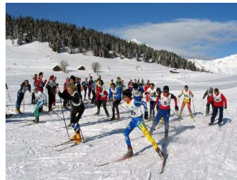
Départ d'une course par équipe

Merci à 74 Nordic qui nous offre le coût des services techniques et l'accès aux pistes.